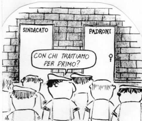
Tür links: Gewerkschaft Tür rechts: Chef „Mit wem sollen wir zuerst verhandeln?“

Packungsbeilage zum Februar Lohnzettel über die Verhandlungen zu Wort gemeldet und die Verhandlungen der IG Metall als positives Beispiel angemahnt. Die IG Metall war, als erste DGB-Gewerkschaft